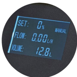
صفحه نمایش بزرگ