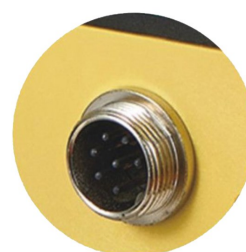
ورودی کنترل سیگنال